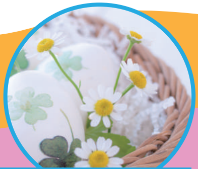
内面を磨くワークショップ