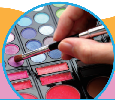
コミュカ・ビジュアル向上ワークショップ