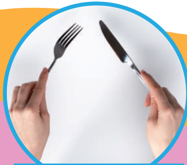
お作法やマナーの講座