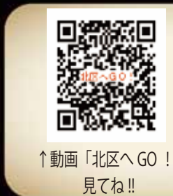
↑動画「北区へGO!」 見てね!!