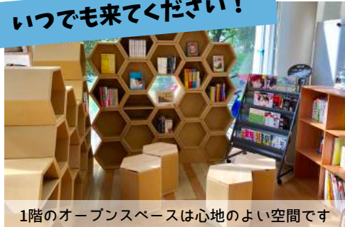
1階のオープンスペースは心地のよい空間です

ユースクエアは、たくさんのイベントが開かれていたり、いろいろなチラシが置かれていたり、居場所スペースとして使えたりもする、出入り自由な空間です。お一人でも、仲間と一緒にでも、ご自由にお使いください。