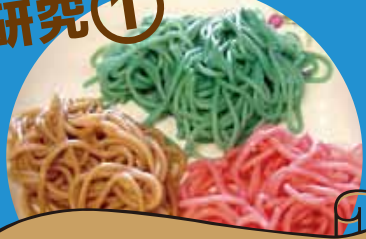
カメレオン冷やし中華