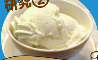
氷でアイスクリーム